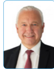
Werner Ottilinger Facility Services