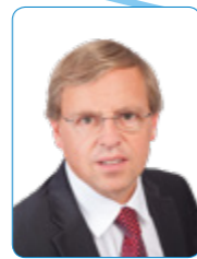
Dr. Felix Gassmann Technology