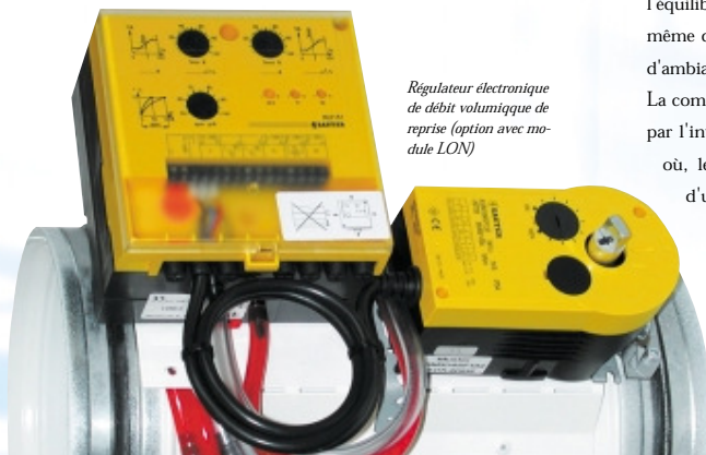
Régulateur électronique de débit volumétrique de reprise (option avec module LON)