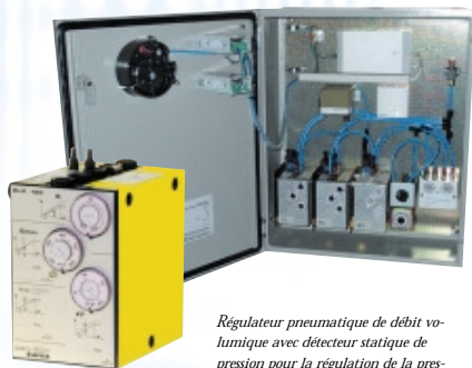
Régulateur pneumatique de débit volumétrique avec détecteur statique de pression pour la régulation de la pression d'air dans le laboratoire. En liaison d'air avec une commande pneumatique des clapets, on considère des fonctionnements nécessitant 3 sec. pour un angle de clapet de 90° comme étant le standard.